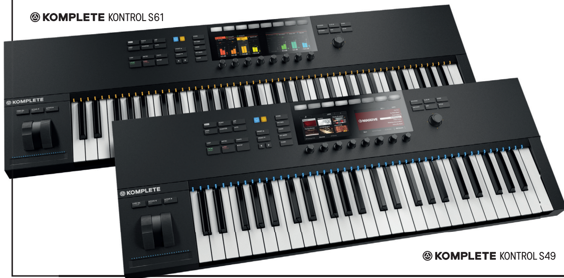
◎ KOMPLETE KONTROL S49